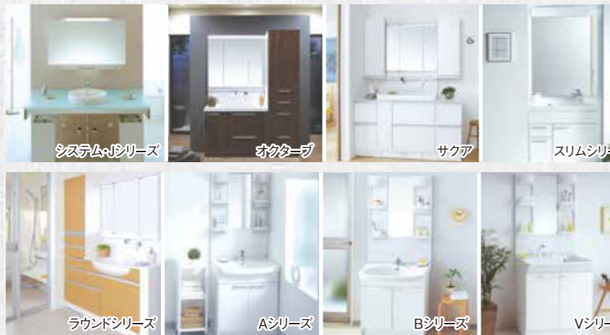
システムPシリーズ オクターブ サクア スリムシリーズ ラウンドシリーズ Aシリーズ Bシリーズ Vシリーズ