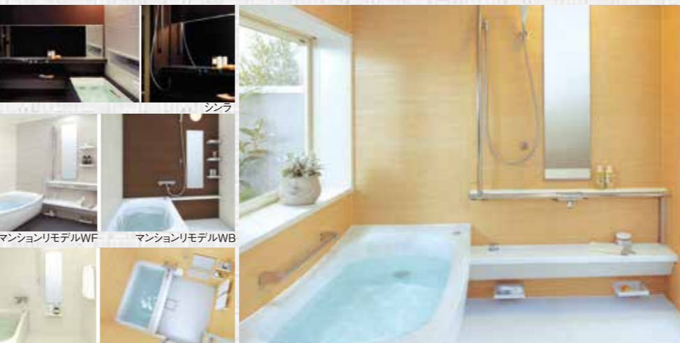
マンショリモデルWF マンショリモデルWB マンショリモデルWT マンショリモデルWH サザナ