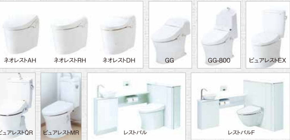
ネオレストAH ネオレストRH ネオレストDH GG GG-800 ピュアレステEX ピュアレストQR ピュアレストMR レストバル レストバルF